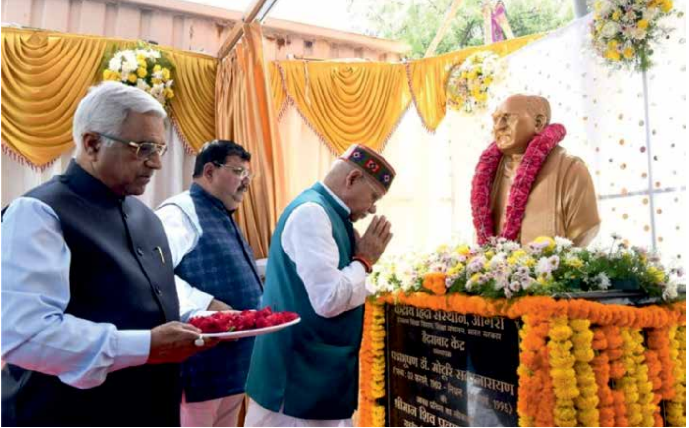
तेलंगाना राज्य के महामहिम राज्यपाल श्री शिव प्रताप शुक्ल ने पद्मभूषण डॉ. मोटूरि सत्यनारायण की प्रतिमा का किया अनावरण।

दिनांक 08.04.2026 को केंद्रीय हिंदी संस्थान, आगरा के संस्थापक पद्मभूषण डॉ. मोटूरि सत्यनारायण जी की आवक्ष प्रतिमा एवं उनकी जीवनी का लोकार्पण केंद्रीय हिंदी संस्थान, बापूजी नगर, बोवेनपल्ली, सिकंदराबाद में माननीय श्री राज्यपाल शिव प्रताप शुक्ल जी के करकमलों द्वारा किया गया। उन्होंने पद्म भूषण डॉ. मोटूरि सत्यनारायण को श्रद्धांजलि अर्पित करते हुए उन्हें एक दूरदर्शी स्वतंत्रता सेनानी और राष्ट्रीय एकता के प्रबल समर्थक के रूप में याद किया।