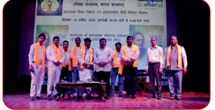
अध्ययक शिक्षा विभाग एवं अंतरराष्ट्रीय हिंदी शिक्षण विभाग द्वारा डॉ. भीमराव अंबेडकर जयंती समारोह का आयोजन अटल विहारी वाजपेयी सभागार में किया गया।