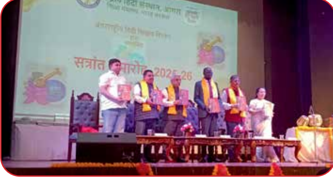
केंद्रीय हिंदी संस्थान, आगरा के अंतरराष्ट्रीय हिंदी शिक्षण विभाग द्वारा हिंदी विश्व भारती पत्रिका का विमोचन किया गया।