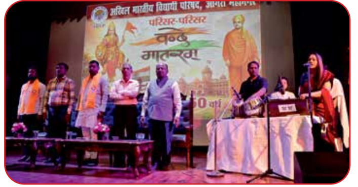
भारत के राष्ट्रगीत वंदे मातरम् के सृजन के 150 गौरवशाली वर्ष पूर्ण होने के उपलक्ष्य में मुख्यालय आगरा के अटल विहारी वाजपेयी सभागार में आयोजन किया गया।