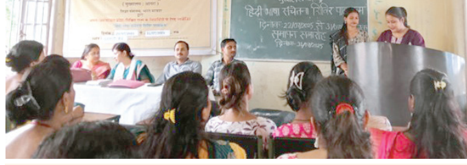
हिंदी भाषा संचेतना शिविर पाठ्यक्रम का आयोजन

दस दिवसीय इस शिविर में व्यावहारिक भाषा प्रयोग, व्याकरण संबंधी सामान्य त्रुटियाँ, शिक्षा एवं संप्रेषण के विविध आयामों पर विशेष ध्यान दिया