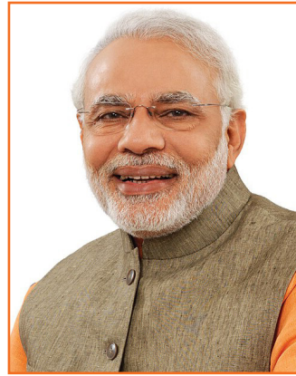
'राष्ट्रीय शिक्षा नीति 2020' के 5 वर्ष प्रधानमंत्री का वक्तव्य

आज देश गौरवशाली भारतीय संस्कृति से जुड़ी शिक्षा को तकनीक और